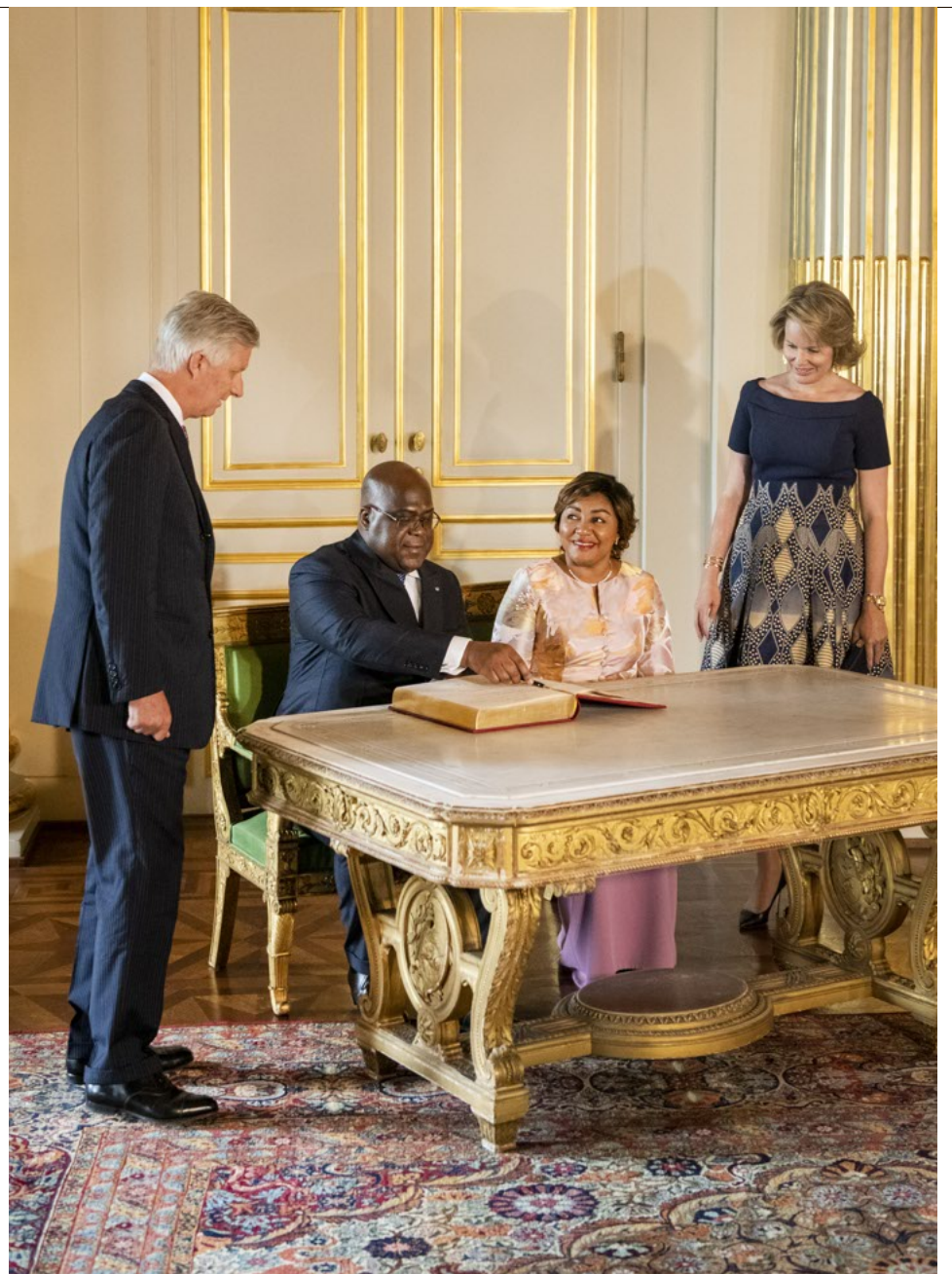
Félix Tshisekedi ging gisteren onder meer langs bij Filip en Mathilde ...